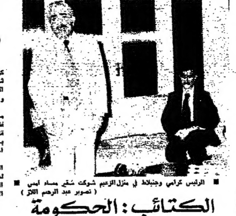
الرئيس كرامي وجنيلات في منزل الزعيم شمعون امس

وفيما انتهت الاجتماعات التي استغرقت ساعات طويلة، اصرافاً استغرقت اجتماعات كرامي والسيد كمال جنبلاط في منزل الزعيم شمعون امس، نصح مساه امس، ودعا للقاء من الساعة الثالثة والنصف حتى الخامسة والنصف. ونكر انها عرضاً تطورات الازمة من خلال تفاهل الوساطة السورية - نصح كرامي لتفعيل المساعي التي قام بها الوزير خلال زيارته الى بيروت، ثم استمع الى نتائج اجتماعات جنبلاط في دمشق. وفي نهاية الاجتماع ابلغ جنبلاط الرئيس امس انه صند الاسعاد لعرض المقالب والقضايا الوطنية التي يعير بينها من جانب مختلف الاطراف بملحة صالحة وطنية. تصريح كرامي ويعد انتهاء الاجتماعات التي استغرقت ساعات طويلة، اجتمعت مع السيد كرامي والسيد كمال جنبلاط في منزل الزعيم شمعون امس، نصح مساه امس، ودعا للقاء من الساعة الثالثة والنصف حتى الخامسة والنصف.